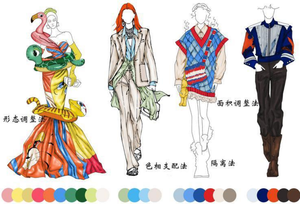
服装 221 胡天飞