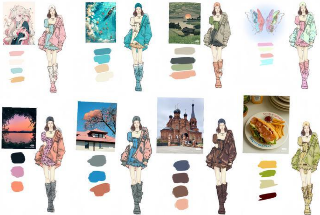
服装 222 桂巧巧