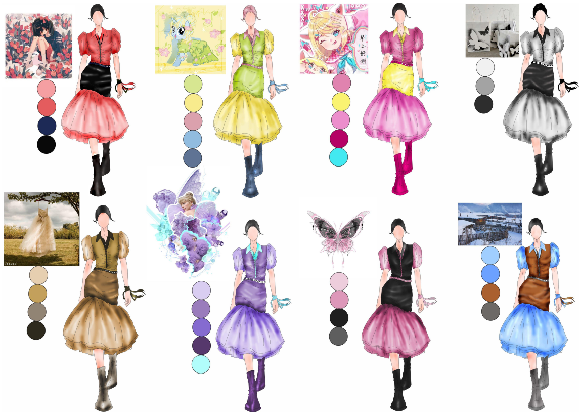
服装 221 魏欣